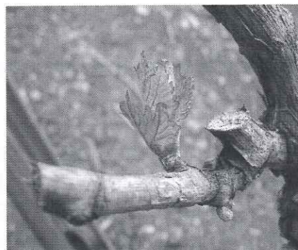
Estado Fen D: Salida de hojas